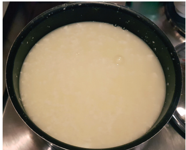
Abb. 7 Der Käsebruch wird noch etwas erhitzt („gebrannt“), damit mehr Molke austritt.