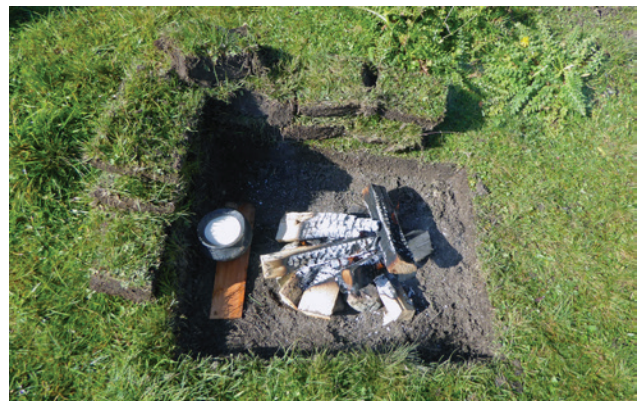
Abb. 19 Das neue „Setting“ mit vorbereitetem Milchtopf.