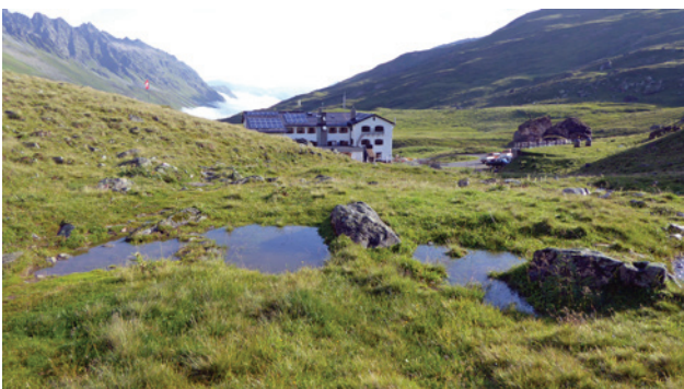
Abb. 16 Nach einem schweren Gewitter in der Nacht ist unsere Feuerstelle überschwemmt.