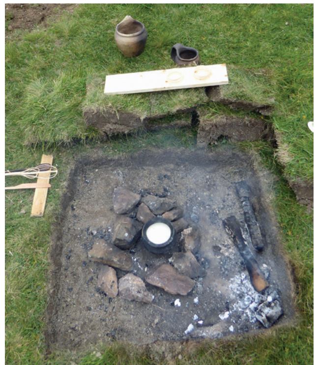
Abb. 15 Vorbereitete Feuerstelle mit Laugen-Melaun-Topf und Utensilien.