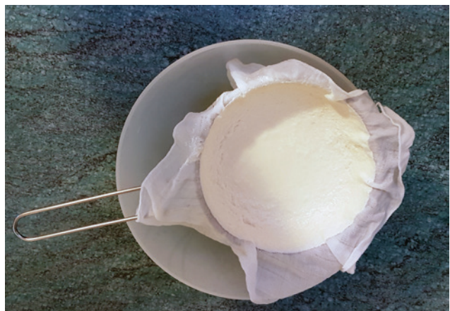
Abb. 9 Aus der übriggebliebenen Molke kann durch Zugabe von etwas Frischmilch oder Rahm und anschließende Fällung durch Säure noch Ricotta gewonnen werden.