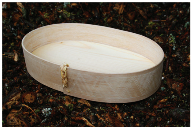
Abb. 11 Von Jonas Nyffeler angefertigter Nachbau einer eisenzeitlichen Spanschachtel aus Hallstatt.