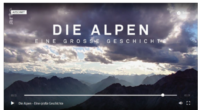
Abb. 1 Screenshot vom Trailer zur Terra-X-Dokumentation „Die Alpen – Eine grosse Geschichte“ ( www.arte.tv ).

Im Rahmen von Filmaufnahmen vom 7. bis 9. August 2017 zur Terra-X-Dokumentation „Die Alpen – Eine grosse Geschichte“ (Abb. 1), in der unter anderem die Fundstellen im Fimbatal thematisiert werden, sollte auch ein online-Zusatzfeature zur prähistorischen Käseherstellung entstehen.