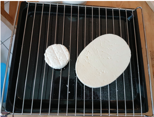
Abb. 12 Ovale Käse für den Nachbau einer eisenzeitlichen Spanschachtel aus Hallstatt.