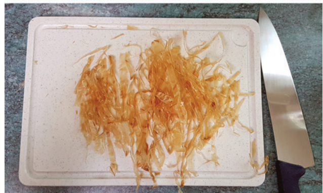
Abb. 5 Getrockneter ganzer (oben) und in feine Streifen geschnittener Kälbermägen (unten). Aus den feinen Streifen wird durch Einlegen in Molke das Lab extrahiert.