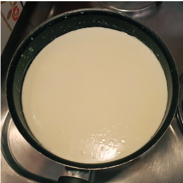
Abb. 6 Die dickgelegte Milch, sog. „Dickete“ beim Versuch auf dem Herd.