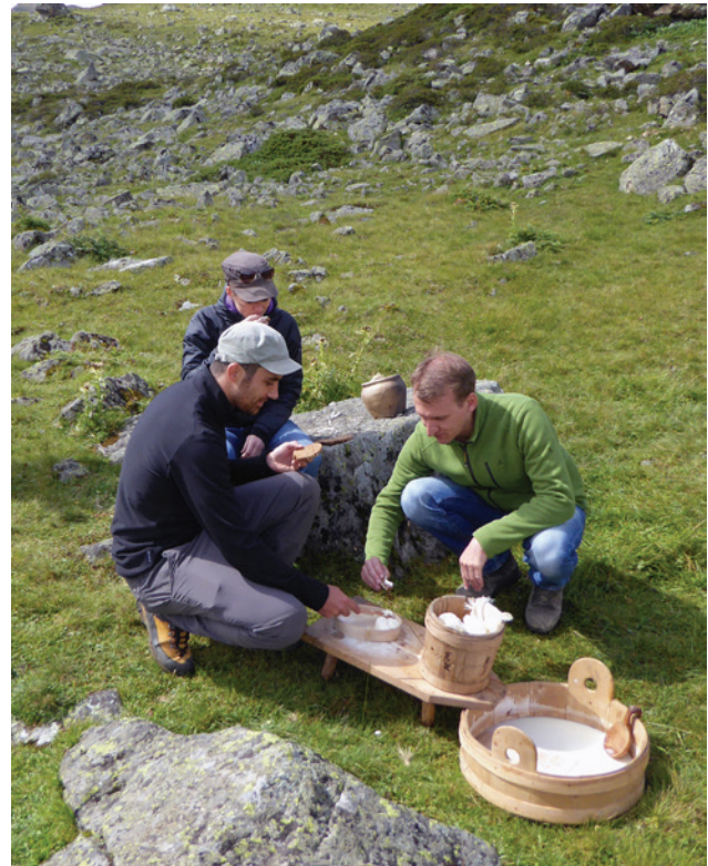
Abb. 22 Mitglieder des ADG und das Filmteam genießen nach getaner Arbeit den frisch hergestellten Käse.