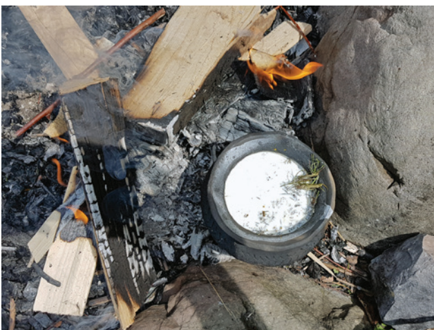
Abb. 10 Versuch mit Labkraut im nachgebauten Laugen-Melaun-Keramikgefäß in der Feuerstelle.