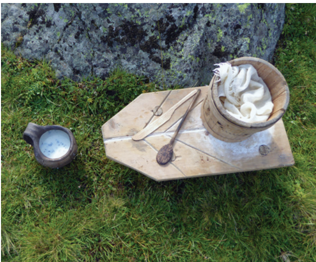
Abb. 18 Die Utensilien fürs Käsen: Laugen-Melaun-Topf mit in der Milch eingelegtem Labkraut, „antikes“ Abtropfgefäss mit Käsetüchlein auf ebensolchem Abtropfbrett, hölzerne Kelle zum Rühren und Holzmesser zum Schneiden der „Dickete“.