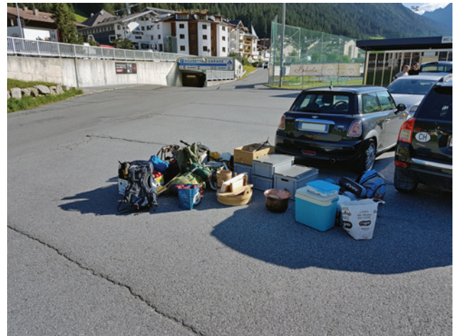
Abb. 13 Unser Material fürs Käsen und den zweieinhalbtägigen Aufenthalt auf der Heidelberger Hütte.