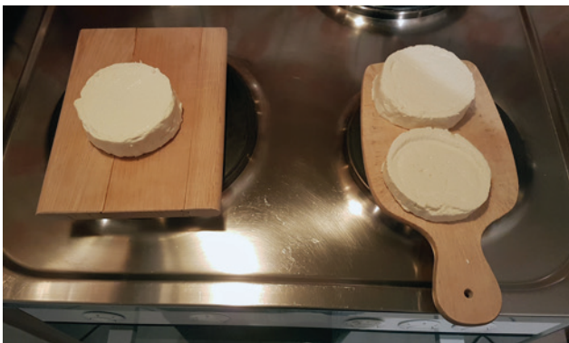
Abb. 8 Aus 1l Milch entstanden zweieinhalb kleine Käse mit ca. 5-6 cm Durchmesser und 2-2.5 cm Dicke.