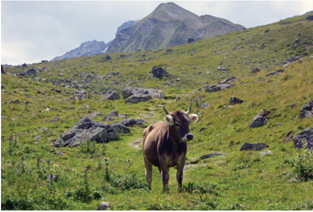
Abb. 23 Eine stolze Kuh an geschichtsträchtigen Ort.