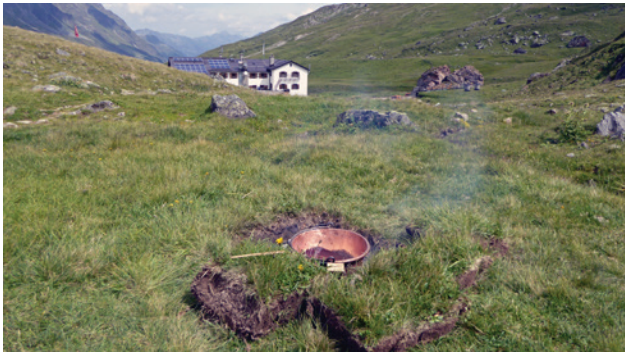
Abb. 14 Versuch mit Kupferkessel in unserer speziell fürs Filmen ausgewählten, sehr offenen Feuerstelle. Im Hintergrund die Heidelberger Hütte.